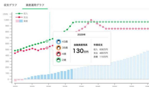
(画像)ライフプランシミュレーションイメージ