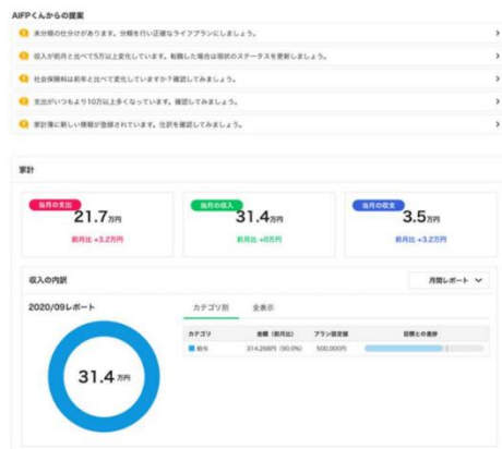
(画像)家計簿とAI-FPからの課題提案イメージ

これまでの相談から培った16000件以上の解決策・案をもとに、ユーザーが自身でライフプランニングや資産管理できるツール『マネソルプラス』を開発しました。ユーザーは、ライフプランや資産管理をアドバイスする「AI—FPくん」とともに、自身の力で金融・不動産資産すべてを可視化しながらライフプランの作成、実行、見直しを行います。また、これまでであった家計簿の機能だけでは成しえなかったお金寿命の可視化、資産分析、シミュレーションが可能です。ユーザーは目標シミュレーションに沿って将来を見据えながら現状の資産を管理し、不安を可視化し解消することができるようになります。また、当社FPとの個別相談も料金内で対応致します。